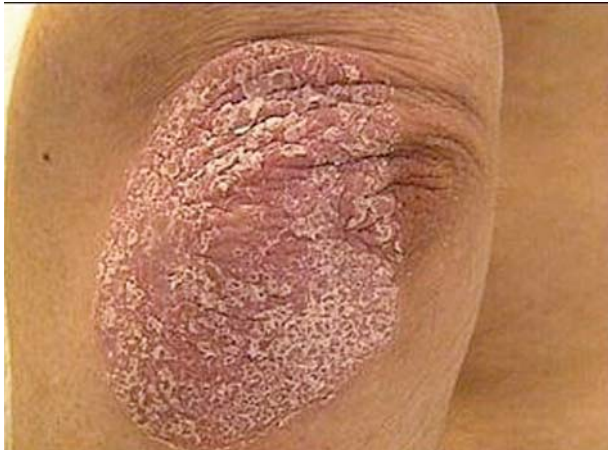
Після 6 тиж лікування