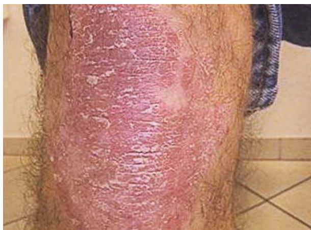
Після 6 тиж лікування